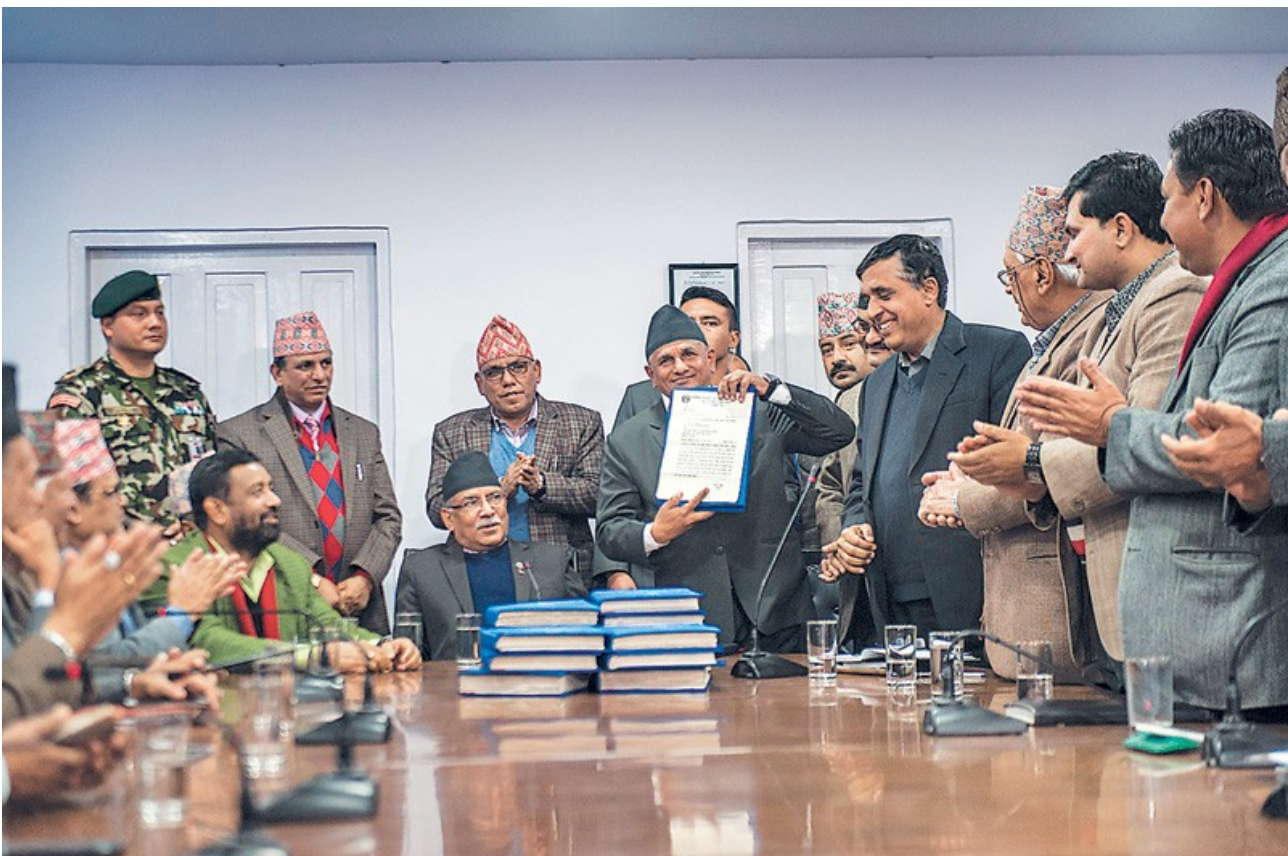
Das LLRC überreicht dem Premierminister seinen Neugliederungsvorschlag (The Kathmandu Post, 14.01.2017)

Bereits die vorhergehende Oli-Regierung hatte ein Local Level Restructuring Committee (LLRC) beauftragt, Vorschläge zu einer drastischen Reduzierung der lokalen Einheiten von derzeit 217 Städten und 3117 Gemeinden auszuarbeiten. Zunächst lief der Vorschlag auf 565 Einheiten hinaus. Nach dem Amtsantritt der Dahal-Regierung wurden die Richtlinien für das LLRC jedoch überarbeitet und es wurde vorgeschlagen die 927 Ilaka, in denen jeweils 4-5 der derzeitigen lokalen Einheiten zusammengefasst sind, zur Grundlage zu nehmen. Zum Jahreswechsel 2016/17 hat das LLRC der Regierung offiziell eine Reduzierung der lokalen Ebene auf 719 Einheiten, 241 Städte und 462 Gemeinden (Village Development Committees, VDC) vorgeschlagen.