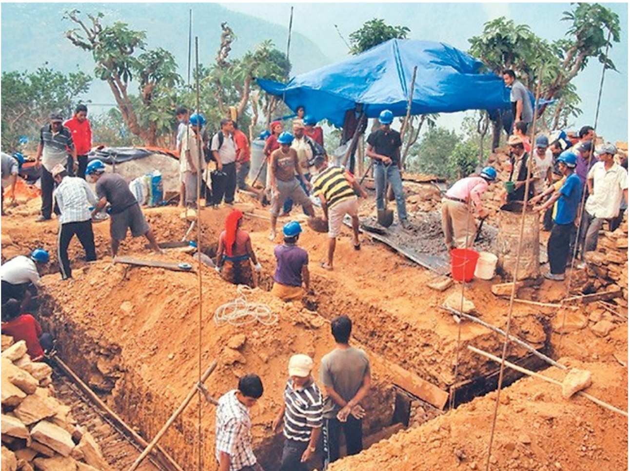
Der Wiederaufbau erfolgt nur stockend

Auch in Bezug auf die Politik der Erdbebenhilfe und des Wiederaufbaus unterscheidet sich die Dahal-Regierung kaum von ihrer Vorgängerregierung. Inzwischen sind 21 Monate seit den schweren Erdbeben von 2015 vergangen. Das Gros der betroffenen Menschen hat zwei Monsune und einen Winter unter Zelt- und Plastikplanen verbringen müssen, was in den Gebirgsdistrikten besonders hart ist. Der zweite Winter ist auch bereits zur Hälfte vorbei. Trotz großer internationaler Hilfszusagen kommt die vor einem Jahr gebildete Behörde NRA (National Reconstruction Authority) nicht voran. Die von internationalen Geldgebern vorgegebene erste Ration von 50.000 Rupien (nach augenblicklichem Umrechnungskurs etwa 430 Euro) ist völlig unzureichend, damit die Menschen überhaupt mit dem Wiederaufbau erdbebensicherer Häuser beginnen können; der gleiche Betrag wurde kürzlich als unzureichendes monatliches Einkommen der Parlamentsabgeordneten eingestuft, selbst ein gutes Mobiltelefon ist in Nepal deutlich teurer.