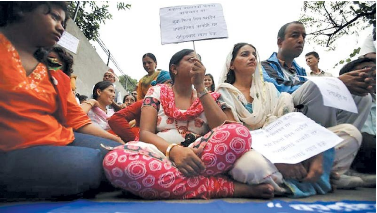
Protestierende Angehörige von Opfern des Aufstands

Vergleicht man das, was die maoistischen Führer dereinst den Menschen versprochen haben und was alle großen Parteien in das Friedensabkommen von 2006 und die Übergangsverfassung von 2007 hineingeschrieben haben, mit dem, was jetzt mit der umstrittenen Verfassung vom September 2015 umgesetzt wurde, dann kehrt rasch Ernüchterung ein. Dabei ist vieles in der neuen Verfassung, wie beispielsweise die Gestaltung des föderalen Staates, nicht mehr als ein vorgegebener Rahmen.