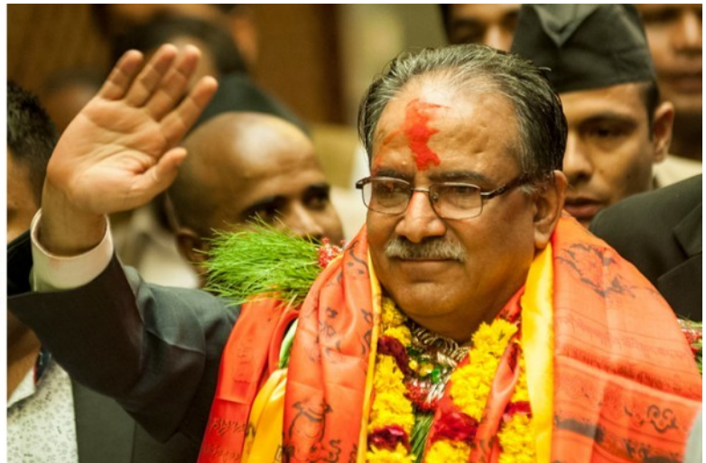
Premierminister Dahal nach seiner Wahl und Stimmenverteilung (The Kathmandu Post, 5.8.2016)

Für die Regierungsbildung bedurfte es aber der Unterstützung weiterer Parteien. Entscheidend waren dabei die Stimmen von Madheshi- und Janajati-Parteien, also genau jener Parteien, die mit vielen Passagen der neuen Verfassung nicht einverstanden sind und eine grundlegende Überarbeitung derselben fordern; die monatelange Wirtschaftsblockade entlang der indischen Grenze im Herbst und Winter 2015/16 ist da noch in guter Erinnerung. So beteiligen sich diese Parteien jetzt auch nicht direkt an der Regierung, sie haben sie nur mitgewählt. Der Umstand, dass sie das Zünglein an der Waage spielen und ggf. helfen können, die Regierung zu Fall zu bringen, gibt ihnen ein gutes Druckmittel bei der Durchsetzung ihrer Forderungen.