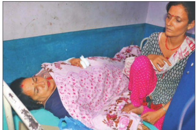
Wahlkandidaten Ram Chandra Poudel (NC) und Yamuna Kafle (CPN-UML) nach Anschlägen

Zwar erklärte die Regierung ständig, die Sicherheitsmaßnahmen und Kontrollen würden immer weiter verschärft, doch tat dies den Anschlägen keinen Abbruch. Unerklärlich ist, dass die Sicherheitskräfte nicht wirklich in der Lage waren, die Kreise ausfindig zu machen, die hinter diesen Anschlägen standen. Allenfalls wurden einige direkt Beteiligte und Handlanger verhaftet. Wiederholt kamen diese aus dem Kreis der CPN (Maoist), also jener radikalen Gruppe der Maoisten um Netra Bikram Chand, der sich mit seiner ursprünglichen Mutterpartei schon länger überworfen hat, eine weitere militante Revolution anstrebt und natürlich die diversen diesjährigen Wahlen ablehnt.