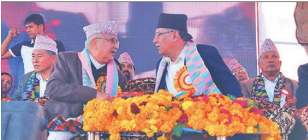
Khadka Prasad Sharma Oli (CPN-UML) und Pushpa Kamal Dahal (CPN-MC) bei einer Veranstaltung in Damak, Jhapa-Distrikt

Vor diesem Hintergrund möchte ich die Wahlallianz von CPN-UML und CPN-MC nur bedingt als logisch bezeichnen, allenfalls als rationaler als die vorige Regierungskoalition von NC und CPN-MC. Ich denke, dass weniger ideologische Gemeinsamkeiten als vielmehr machtpolitisches Kalkül den Ausschlag gaben. Keine der drei großen Parteien ist derzeit in einer Situation, aus der heraus sie eine absolute Mehrheit bei den Wahlen erlangen kann, das haben die jetzigen Wahlen bestätigt. Die CPN-MC ist nicht einmal in der Lage, auch nur annähernd ein ähnlich gutes Wahlergebnis wie 2008 zu erzielen, als sie von etwa 30 Prozent der Wähler gewählt wurde. Sie ist heute die mit Abstand kleinste der drei großen Parteien. Wenn sie nicht noch weiter abrutschen wollte, war eine Wahlallianz mit der Partei, der man angesichts des Wahlergebnisses der lokalen Wahlen die größte Chance auf eine relative Mehrheit bei den anstehenden Wahlen einräumen konnte, vielleicht die optimale Lösung. Dies sicherte der CPN-MC nicht nur ein gewisses Maß an Sitzen, sondern auch die Aussicht auf eine zukünftige Machtbeteiligung nach den Wahlen. Auf der anderen Seite wusste auch die CPN-UML, dass es nicht zu einer alleinigen absoluten Mehrheit reichen würde. Bei einer Absprache mit der CPN-MC bezüglich der Aufstellung von Kandidaten in den diversen Wahlbezirken, erhöhte sich daher die Chance auf eine gemeinsame absolute Mehrheit deutlich.