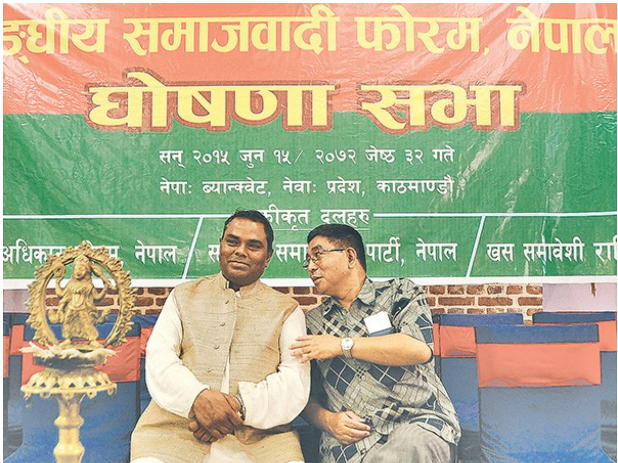
Upendra Yadav und Ashok Rai auf der Gründungsveranstaltung des SSFN

So bleibt das Fazit, dass die Vereinbarung der Parteiführer allenfalls als ein gemeinsamer Vorschlag der großen Parteien zur Verabschiedung einer neuen Verfassung eine Rechtmäßigkeit besitzt. Da es sich aber um einen Vorschlag ausschließlich aus dem Kreis der traditionellen hochkastigen männlichen Staatselite handelt und man nicht einmal ansatzweise versucht hat, andere gesellschaftliche Kreise zu beteiligen, ganz zu schweigen davon, deren Anliegen in irgendeiner Weise zu berücksichtigen, darf es sich allenfalls um einen von mehreren Vorschlägen handeln. Die Entscheidung über die neue Verfassung muss letztlich bei jedem gewählten Abgeordneten der VV liegen, ohne Einflussnahme der jeweiligen Parteispitze. Inhaltlich verstoßen einige der jetzigen Vereinbarungen jedenfalls in gravierender Form gegen die Grundprinzipien der Übergangsverfassung.