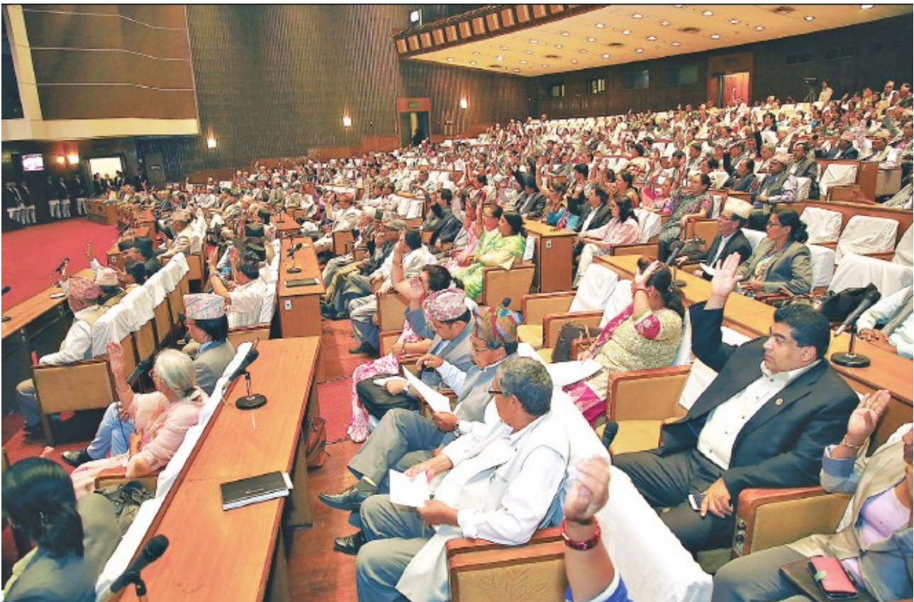
Die VV am 9. Juni bei der Diskussion bestehender Differenzen zwischen den Parteien

Es versteht sich von selbst, dass das fortgesetzte Bekenntnis zur Vielparteiendemokratie zu begrüßen ist. Darüber hinaus bekennt sich das 16-Punkte-Abkommen auch zur Fortsetzung eines parlamentarischen Systems. Zuvor hatte die UCPN-M ein präsidentiales System mit einem mächtigen und vom Volk direkt zu wählenden Präsidenten gefordert. Hierbei mögen die fortgesetzten Machtansprüche des Parteivorsitzenden Pushpa Kamal Dahal keine unwesentliche Rolle gespielt haben. Man muss andererseits aber auch eingestehen, dass das seit 1991 praktizierte parlamentarische System wiederholt große Schwächen gezeigt hat. Das galt ganz besonders für Phasen, wenn keine Partei im Parlament über eine absolute Mehrheit verfügte und folglich Koalitionsregierungen gebildet werden mussten, also für die Jahre 1994-99 und seit 2008. Aber selbst in Zeiten, als der NC über eine absolute Mehrheit der Sitze im Parlament verfügte, sorgten die innerparteilichen Fraktionsbildungen dafür, dass es keine längerfristig stabilen Regierungen gab, so 1991-94 und 1999-2002. Dies alles muss aber nicht zwangsläufig bedeuten, dass ein präsidentiales System die bessere Lösung für Nepal wäre.