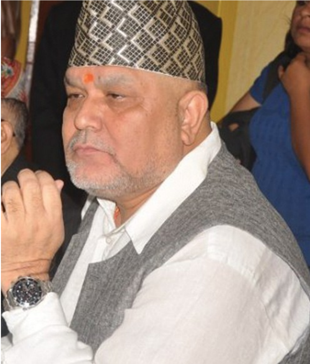
Lokman Singh Karki

Es wurde bekannt, dass Karki neben der offiziellen CIAA noch eine Art Parallelorganisation aufgebaut hatte, die mit allen möglichen technischen Ausstattungen versehen war und an der auch führende Polizeibeamte beteiligt waren. Darüber wurde Klage beim Obersten Gerichtshof gegen Karki erstattet, der jedoch Vorladungen dieses Gerichts missachtete. In dieser Situation leiteten die oppositionelle CPN-UML und die Regierungspartei CPN-MC ein Amtsenthebungsverfahren gegen Karki ein. Der ebenfalls an der Regierung beteiligte NC verweigerte eine klare Stellungnahme zu dieser Kampagne. Das Verfahren war auch Mitte Januar 2017 noch immer im ständig blockierten Parlament anhängig. Zu diesem Zeitpunkt hatte der Oberste Gerichtshof bereits entschieden, dass Karki überhaupt nicht für das Amt des Vorsitzenden der CIAA qualifiziert war und niemals hätte ernannt werden dürfen. Gegen andere CIAA-Funktionäre werden übrigens ähnliche Vorwürfe erhoben.