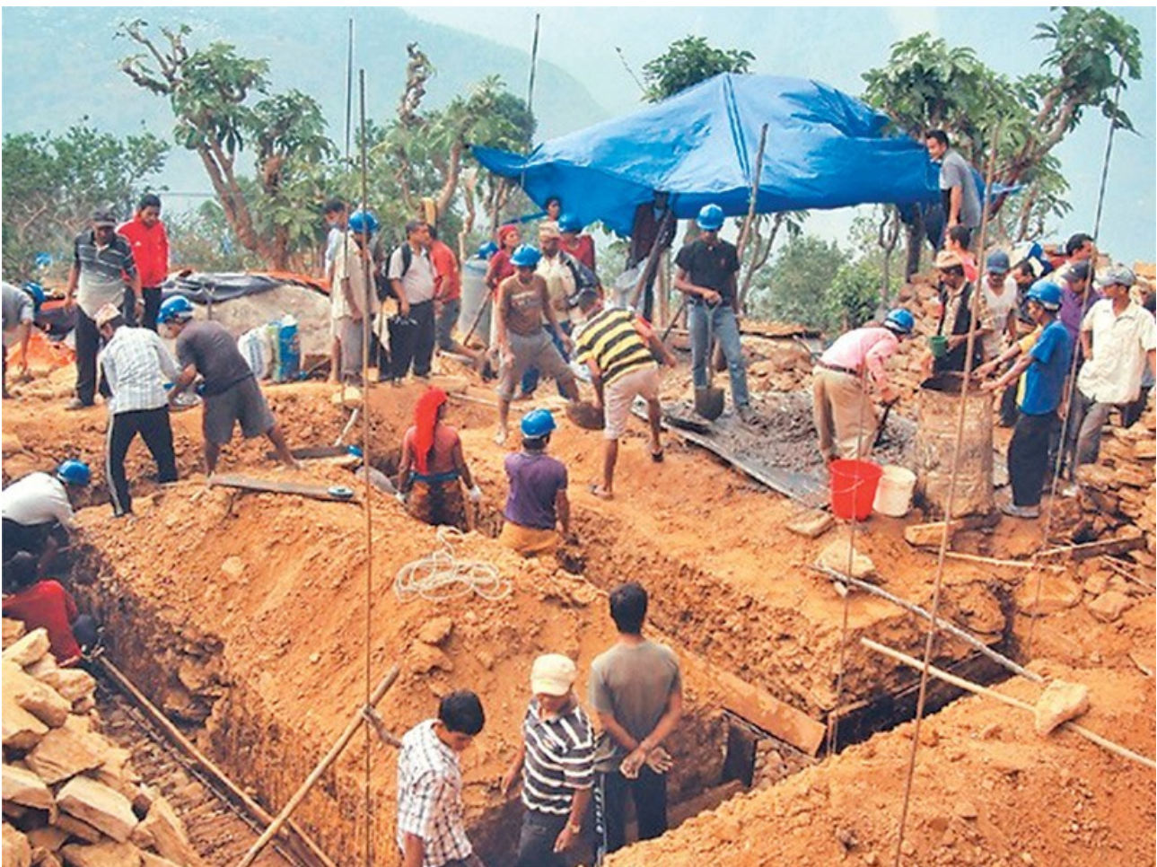
Der Wiederaufbau erfolgt nur stockend (The Kathmandu Post, 20.12.2016)

Auch in Bezug auf die Politik der Erdbebenhilfe und des Wiederaufbaus unterscheidet sich die Dahal-Regierung kaum von ihrer Vorgängerregierung. Inzwischen sind 21 Monate seit den schweren Erdbeben von 2015 vergangen. Das Gros der betroffenen Menschen hat zwei Monsune und einen Winter unter Zelt- und Plastikplanen verbringen müssen, was in den Gebirgsdistrikten besonders hart ist. Der zweite Winter ist auch bereits zur Hälfte vorbei. Trotz großer internationaler Hilfszusagen kommt die vor einem Jahr gebildete Behörde NRA (National Reconstruction Authority) nicht voran. Die von internationalen Geldgebern vorgegebene erste Ration von 50.000 Rupien (nach augenblicklichem Umrechnungskurs etwa 430 Euro) ist völlig unzureichend, damit die Menschen überhaupt mit dem Wiederaufbau erdbebensicherer Häuser beginnen können; der gleiche Betrag wurde kürzlich als unzureichendes monatliches Einkommen der Parlamentsabgeordneten eingestuft, selbst ein gutes Mobiltelefon ist in Nepal deutlich teurer.