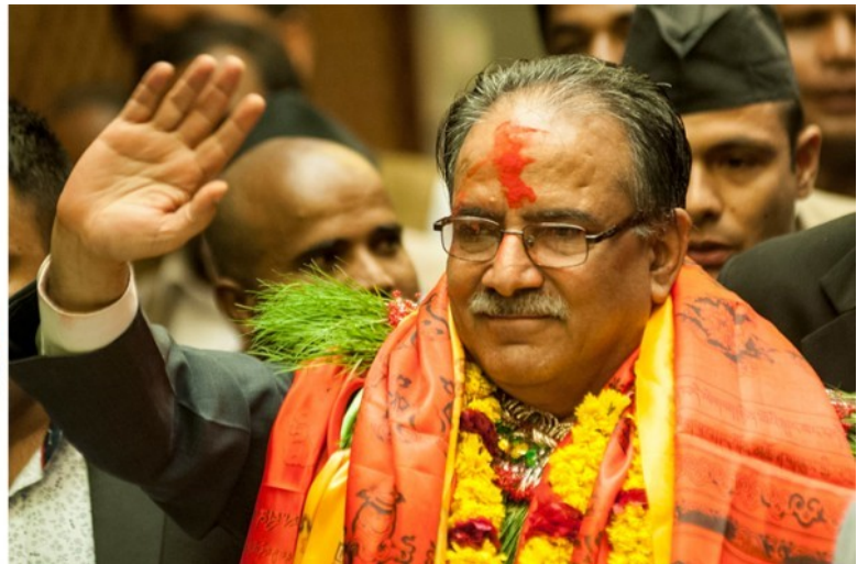
Premierminister Dahal nach seiner Wahl und Stimmenverteilung (The Kathmandu Post, 5.8.2016)

Für die Regierungsbildung bedurfte es aber der Unterstützung weiterer Parteien. Entscheidend waren dabei die Stimmen von Madheshi- und Janajati-Parteien, also genau jener Parteien, die mit vielen Passagen der neuen Verfassung nicht einverstanden sind und eine grundlegende Überarbeitung derselben fordern; die monatelange Wirtschaftsblockade entlang der indischen Grenze im Herbst und Winter 2015/16 ist da noch in guter Erinnerung. So beteiligen sich diese Parteien jetzt auch nicht direkt an der Regierung, sie haben sie nur mitgewählt. Der Umstand, dass sie das Zünglein an der Waage spielen und ggf. helfen können, die Regierung zu Fall zu bringen, gibt ihnen ein gutes Druckmittel bei der Durchsetzung ihrer Forderungen.