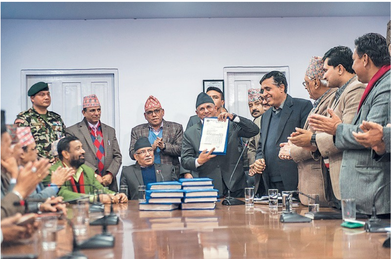
Das LLRC überreicht dem Premierminister seinen Neugliederungsvorschlag (The Kathmandu Post, 14.01.2017)

Bereits die vorhergehende Oli-Regierung hatte ein Local Level Restructuring Committee (LLRC) beauftragt, Vorschläge zu einer drastischen Reduzierung der lokalen Einheiten von derzeit 217 Städten und 3117 Gemeinden auszuarbeiten. Zunächst lief der Vorschlag auf 565 Einheiten hinaus. Nach dem Amtsantritt der Dahal-Regierung wurden die Richtlinien für das LLRC jedoch überarbeitet und es wurde vorgeschlagen die 927 Ilaka, in denen jeweils 4-5 der derzeitigen lokalen Einheiten zusammengefasst sind, zur Grundlage zu nehmen. Zum Jahreswechsel 2016/17 hat das LLRC der Regierung offiziell eine Reduzierung der lokalen Ebene auf 719 Einheiten, 241 Städte und 462 Gemeinden (Village Development Committees, VDC) vorgeschlagen.